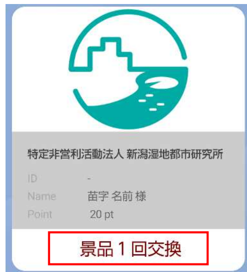
図. 景品交換後のイメージ